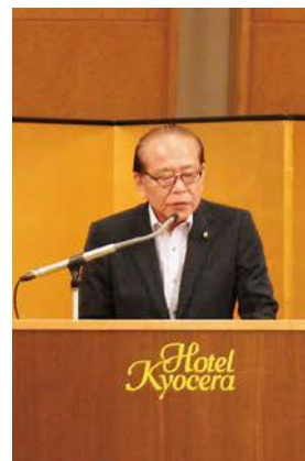
仮屋議長あいさつ