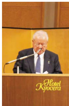
鎌田会頭あいさつ