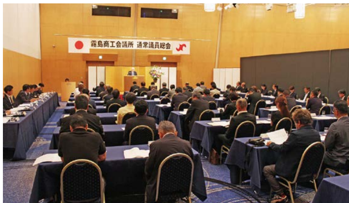
通常議員総会の様子

商工会議所法に係る法令に定められた内容に対応するための定款の一部改正について、原案通り可決承認されました。