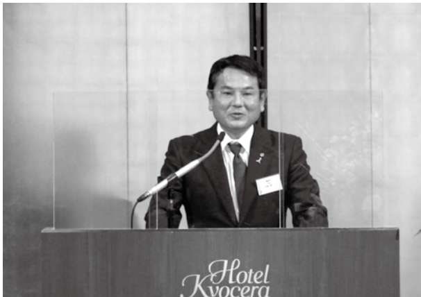
中重市長あいさつ

当日は、会議所役員議員、来賓、128名にご参加いただき、コロナウイルス感染防止の観点からホテル京セラの感染対策を遵守し、盛会に終了しました。