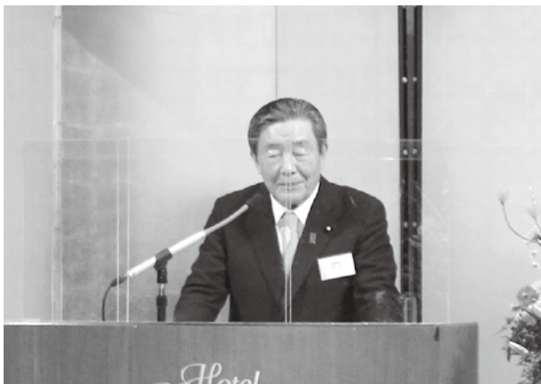
森山議員あいさつ