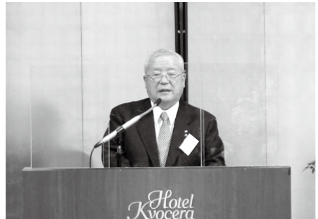
鎌田会頭あいさつ