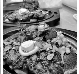
▲網焼リブローズステーキ