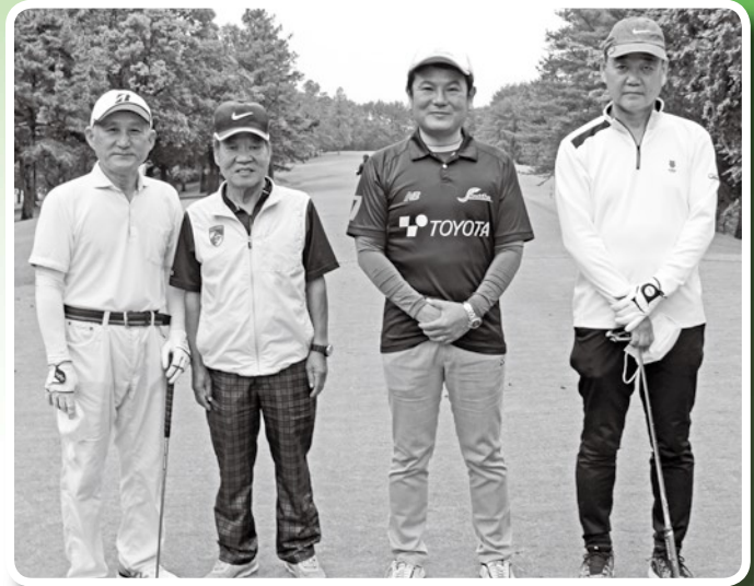
チャリティゴルフ大会スタート前の様子