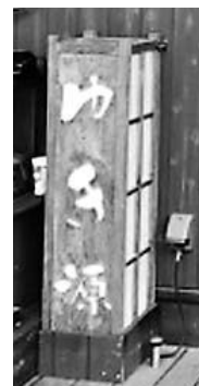
▲落ち着いた雰囲気でお食事が楽しめます。

当店は、平成17年12月に新市街通りで創業、平成30年3月に現在地に移転しました。地域の多くの皆様に支えられ現在に至っています。