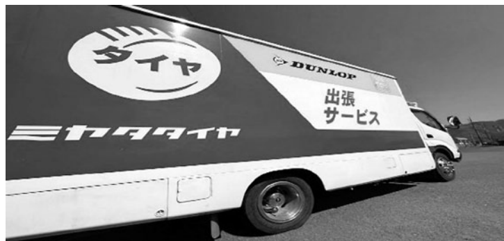
▲サービスカーで 24 時間対応します