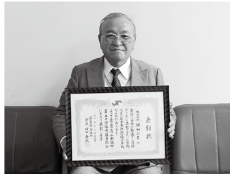
功労賞受賞 株式会社鎌田工業