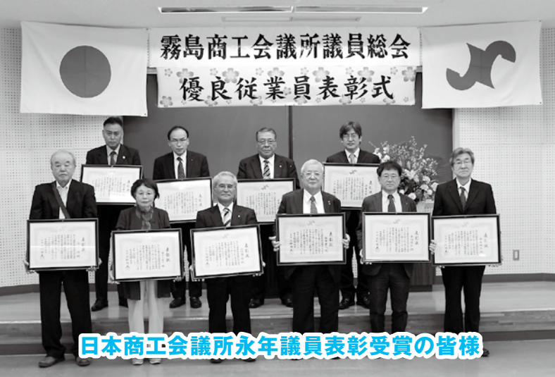
日本商工会議所永年議員表彰受賞の皆様