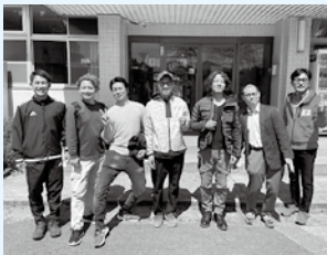
たからべ森の学校

以上の訪問を通じて「自然」と「体験」の結びつきにより外部から多くの観光客を招くことができることを体感し、創意工夫次第で収益を生み出すことができること、そのための資源が地域の森林に潜在していることを学習することができました。