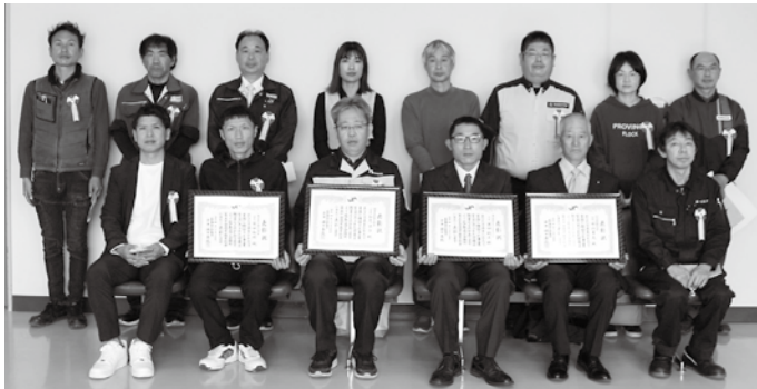
優良従業員表彰受賞式に出席された皆様