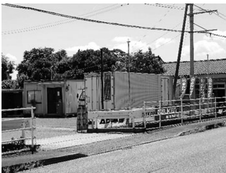
▲国道 10 号線沿いに位置する事務所と倉庫

今後、補助金で導入した機械を活用して、会社がさらに発展し、地域経済のお役に立てるよう努力していきます。